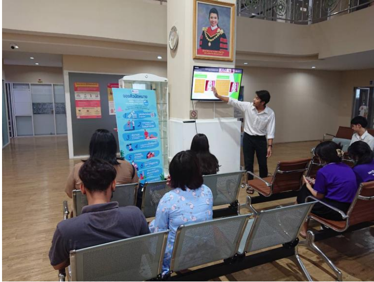
รูปที่ 3 การสอนทันตสุขศึกษา ให้กับประชาชนที่มาใช้บริการ ณ สหคลินิก