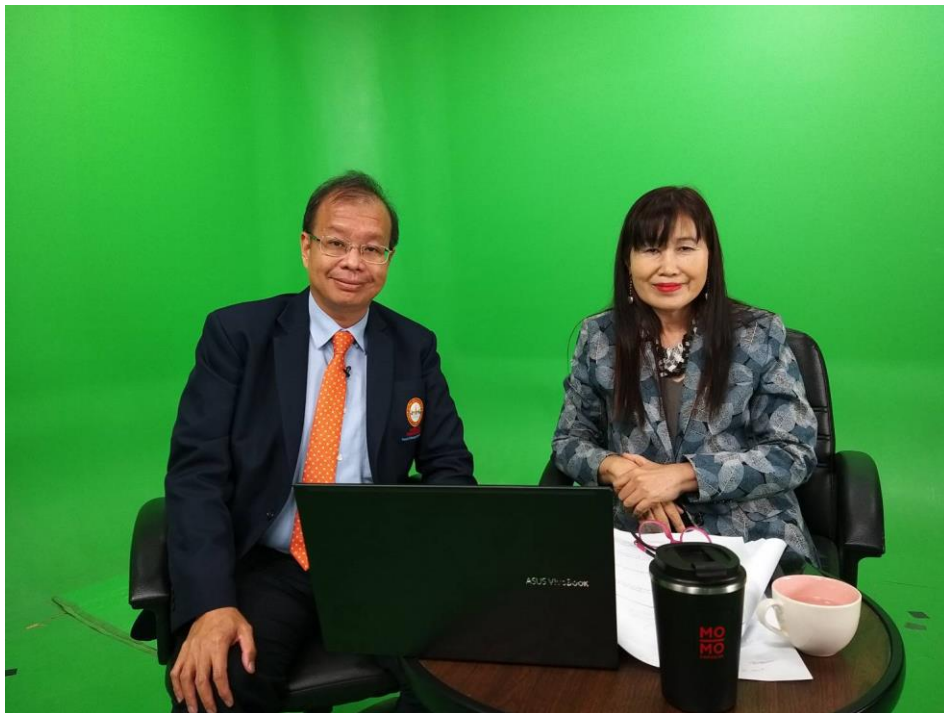
รูปที่ 2 การออกรายการโทรทัศน์ให้ความรู้กับประชาชน

4. หลักการรับผิดชอบ การดำเนินการด้านหลักสูตรและโครงการต่างๆ ของคณะทันตแพทยศาสตร์ มีวัตถุประสงค์หลักในด้านความรับผิดชอบต่อปัญหาสาธารณะ ทั้งในระดับชาติ เช่น การขาดแคลนทันตแพทย์ผู้เชี่ยวชาญ การขาดแคลนนวัตกรรมและการสร้างองค์ความรู้ใหม่ในวิชาชีพ หรือในระดับชุมชน เช่น การออกรายการโทรทัศน์ให้ความรู้กับประชาชน (รูปที่ 2) การสอนทันตสุขศึกษาให้กับประชาชนที่มารับบริการ ณ สหคลินิก (รูปที่ 3 และตารางที่ 2) หรือการดูแลสุขภาพช่องปากให้กับผู้ป่วยในโครงการหลักประกันสุขภาพถ้วนหน้า ซึ่งเป็นการเพิ่มกลุ่มเป้าหมายในการบริการประชาชนในชุมชนใกล้เคียงเพิ่มเติมจากการบริการกับนักศึกษา คณาจารย์ และบุคลากรของมหาวิทยาลัย นอกจากนี้คณะฯ ยังได้มีการกำหนดตัวผู้รับผิดชอบสำหรับภารกิจในแต่ละด้านอย่างชัดเจน เช่น การบริหารหลักสูตร การบริหารบุคลากร การประกันคุณภาพและการดำเนินการโครงการต่างๆ