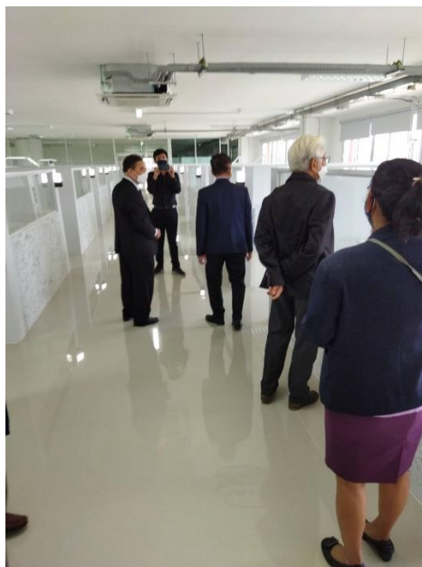
รูปที่ 1 การปรับปรุงคลินิกทันตกรรม รับการตรวจประเมินจากคณะอนุกรรมการตรวจประเมินหลักสูตรของทันตแพทยสภา