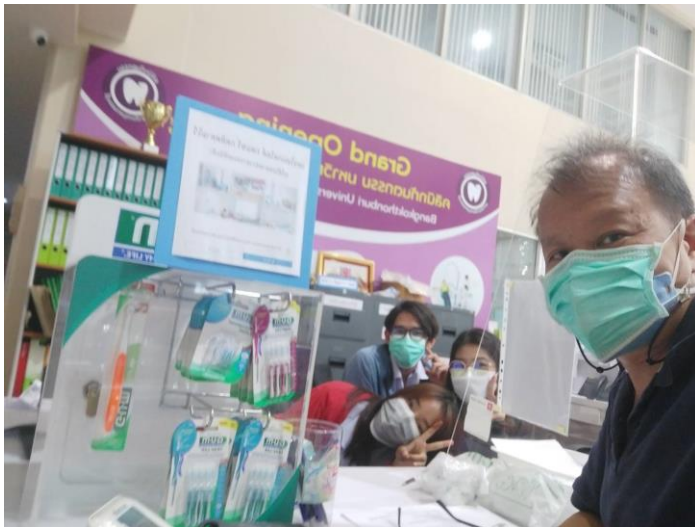
รูปที่ 4 การประชุมเพื่อจัดทำคู่มือบริหารจัดการคลินิกทันตกรรม

ตัวอย่างของแนวทางปฏิบัติที่เน้นการมีส่วนร่วมของผู้ปฏิบัติงานอยู่ในภาคผนวก กล่าวคือได้มีการประชุมเจ้าหน้าที่ ที่ปฏิบัติงาน ณ สหคลินิก เพื่อจัดทำคู่มือระบบบริหารจัดการคลินิกทันตกรรม (รูปที่ 4) จากนั้นให้เจ้าหน้าที่เป็นผู้ร่างคู่มือขึ้นมา แล้วทีมผู้บริหารเข้าไปช่วยปรับให้คู่มือมีความสมบูรณ์ โดยใช้ร่างที่เจ้าหน้าที่เป็นผู้จัดทำขึ้น